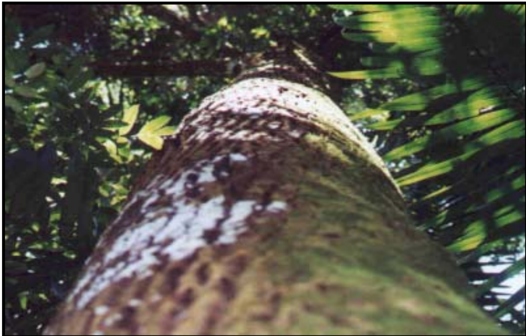
Foto 4. Árbol de bosque primario en la isla de Coiba